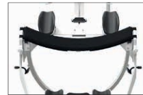
Reguliuojama klubo sąnario atrama