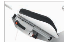
Reguliuojami porankiai nustatymas/užraktas